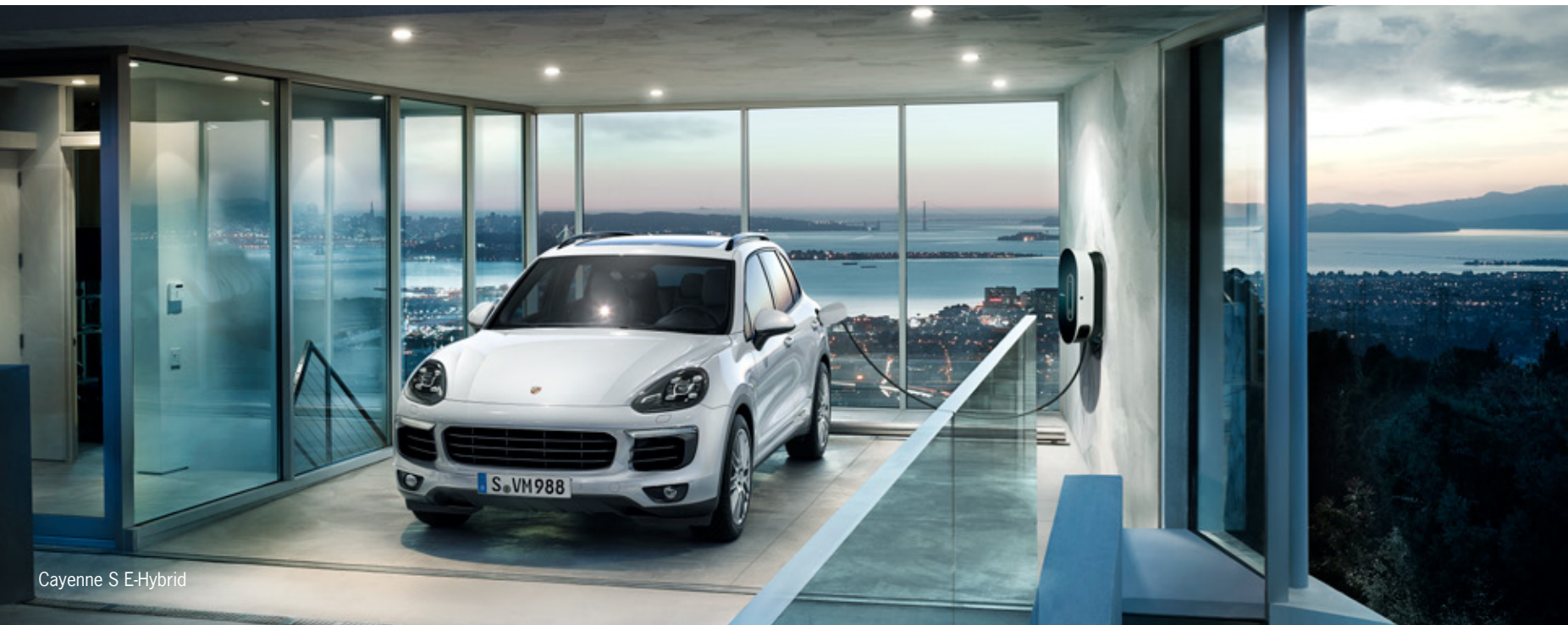
Cayenne S E-Hybrid