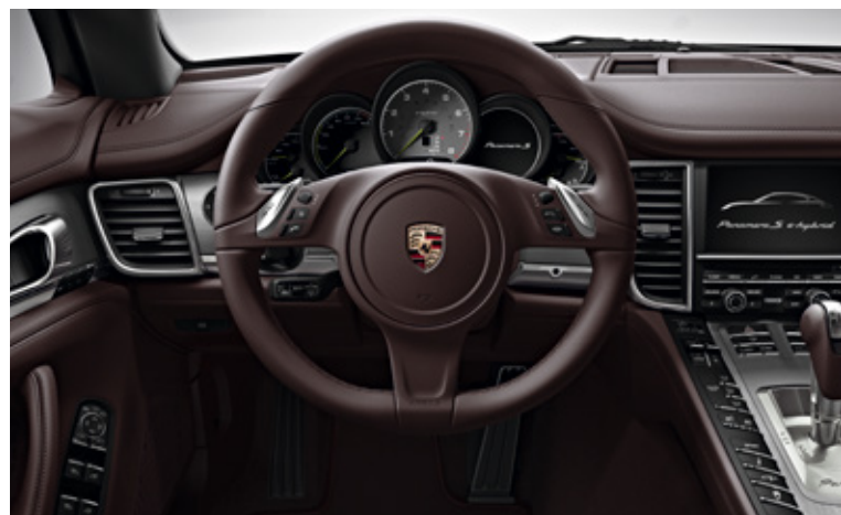
Panamera S E-Hybrid